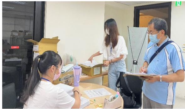
照片 2 說明：整理書表