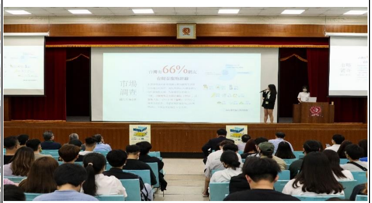
照片 2 說明：同學發表照片 2