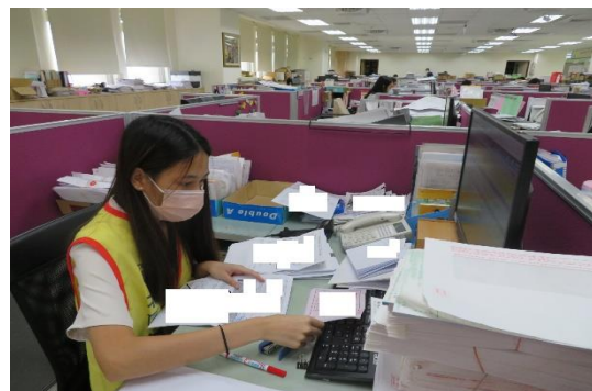
照片 4 說明：檢視憑證