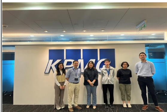
照片 1 說明：KPMG