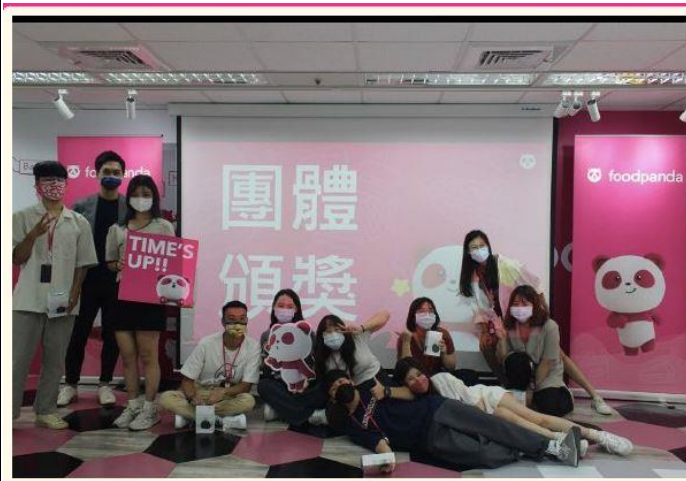
照片 4 說明：實習企業-foodpanda 公司