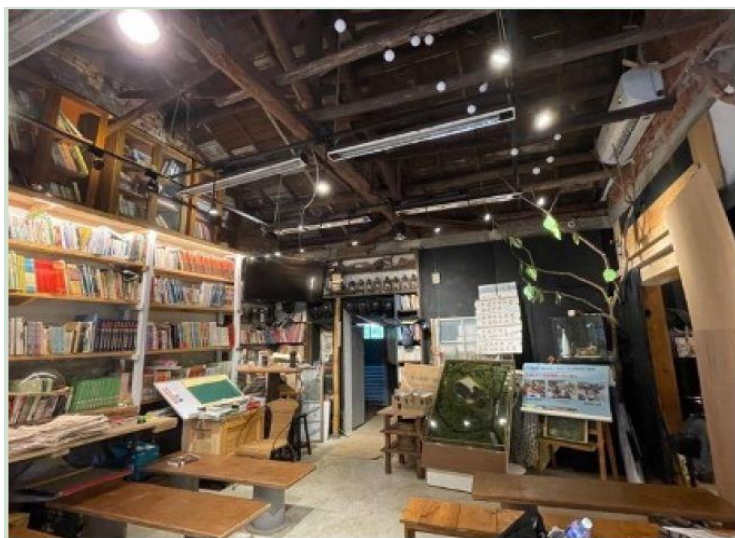
照片 1 說明：實習企業-螢火蟲書屋內部樣貌