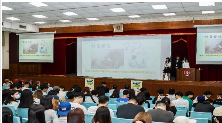
照片 1 說明：同學發表照片 1