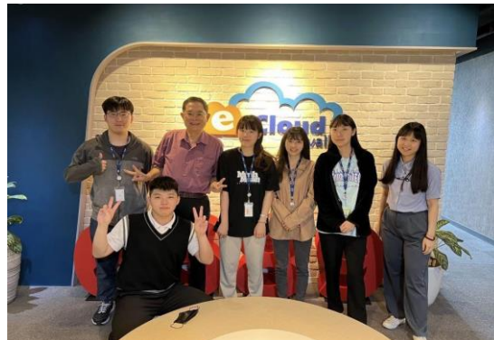
照片 4 說明：伊雲谷