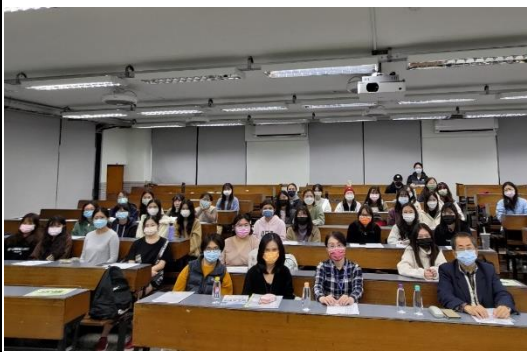
照片 1 說明：行前說明會