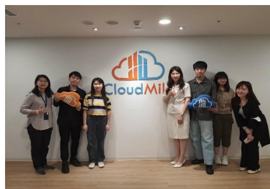
照片 2 說明：萬里雲