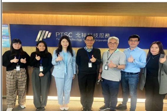
照片 3 說明：北祥科技服務