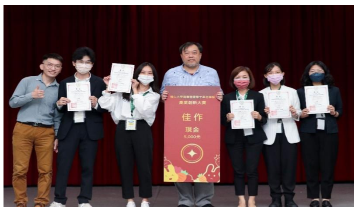
照片 3 說明：產創大賽照片