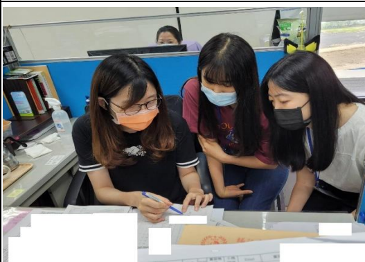
照片 3 說明：聆聽稅務員解說中