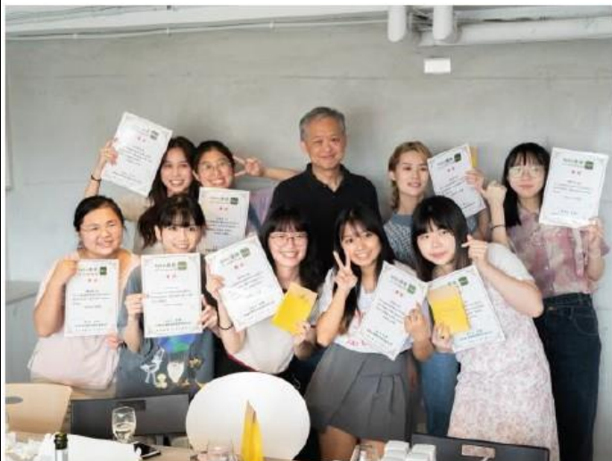
照片 2 說明：實習企業-醫鼎科技行銷實習