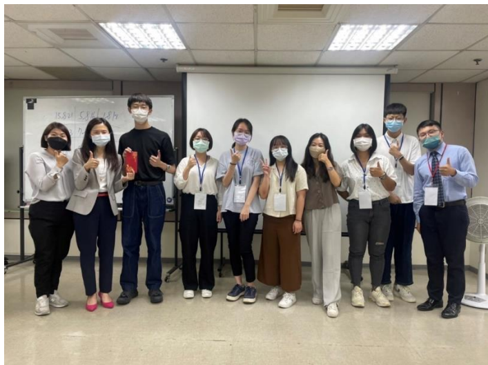
照片 3 說明：實習企業-南山人壽