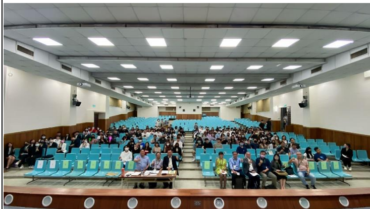
照片 4 說明：產創大賽團體照