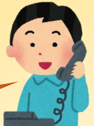
生輔組獎懲承辦人