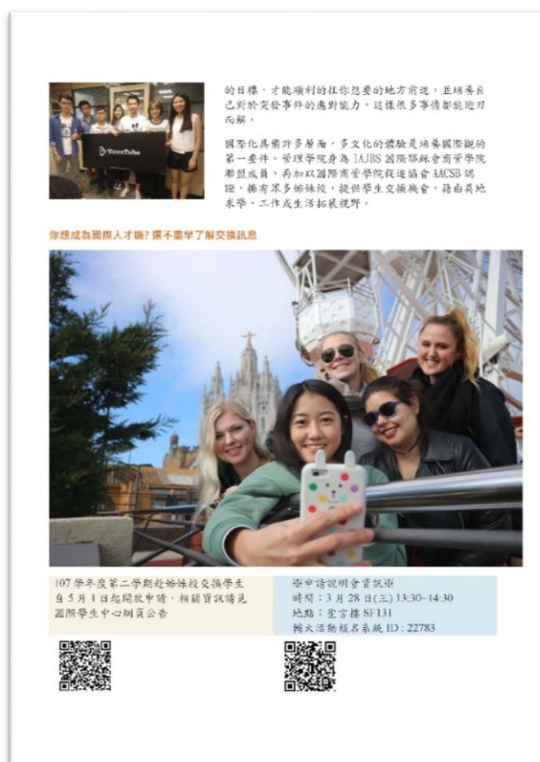
圖三：交換生體驗報導