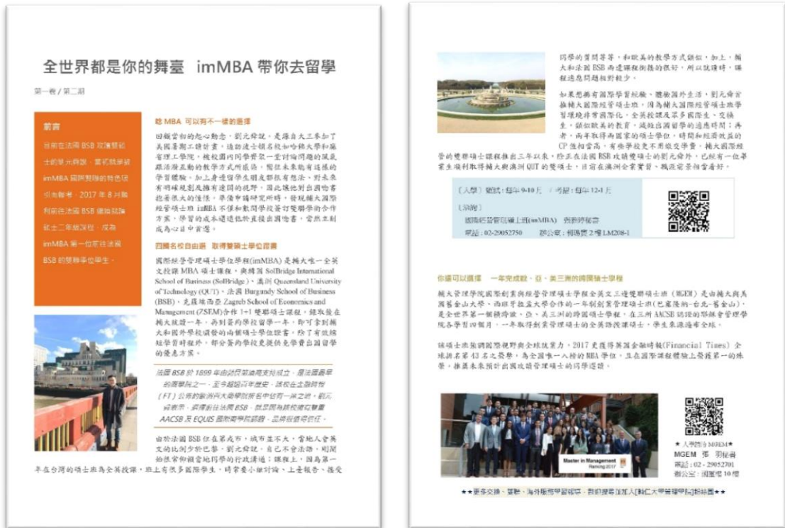
圖四：國際雙聯學位學程報導