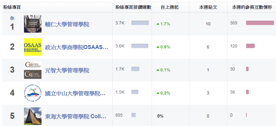
圖一：輔大管理學院相較於其他競爭品牌之粉絲頁經營狀況(資料來源:FB)

2015 年 9 月開始啟動管院粉絲頁管理以來，先透過活動分享、焦點議題來拉抬人氣，2018 年 4 月開始嘗試粉絲頁推廣合作，粉絲人數由 2015 年 9 月的 1900 人成長至 2018 年 5 月 17 日的 3721 人，今年度希望達成突破 4000 人目標。依 FB 洞察報告顯示(圖一)，相較於其他競爭對手(以擁有院粉絲專業來看)，輔大管理學院 FB 粉絲團目前營運策略還算正確。