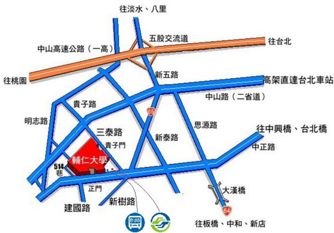
輔仁大學交通位置圖